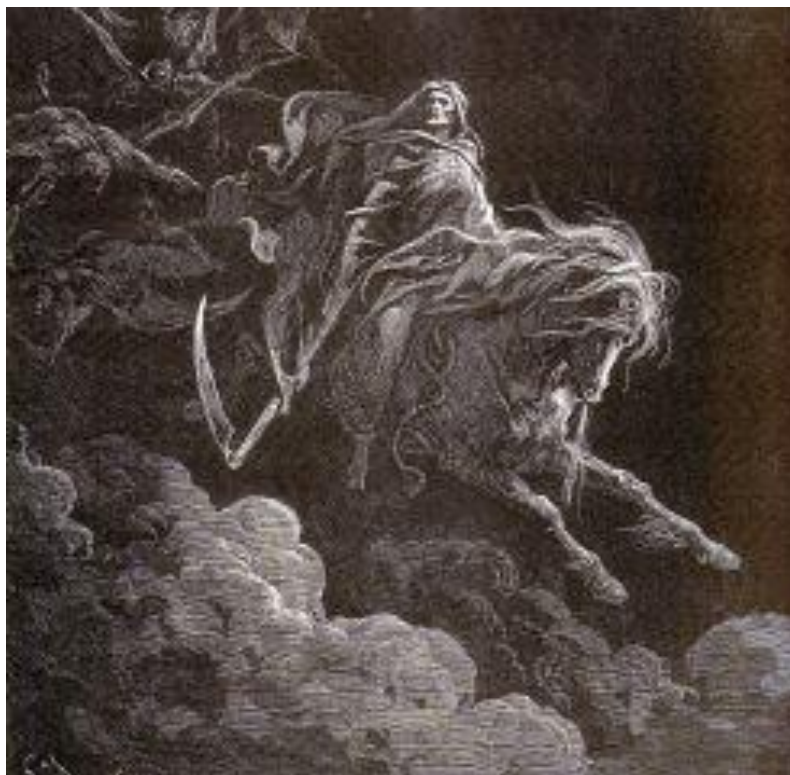
Fig. 3: Gustave Doré, La mort , xilografia da La Sainte Bible selon la Vulgate . Traduction nouvelle de l'abbé Jean-Jacques Bourassé avec les dessins de Gustave Doré. A. Mame et fils (Tours), 1866, 2 vol. Tome II: Nouveau testament, p. 872. Tavola fuori testo disegno di Gustave Doré, incisione su legno di Héliodore Pisan, Musée d'Orsay – BNF, Réserve des livres rares, Smith Lesouëf R-6283 Bibliothèque Nationale de France

Eppure se non viene immaginato un dopo , se non si delinea all'orizzonte ciò che sarà o potrà essere, l' adesso risulta un inferno, una dannazione. Infatti il dopo dà consistenza al senso dell' adesso . Se sottraiamo questo senso fino al suo grado zero, l' adesso si pietrifica, risulta invivibile. La vita non riesce più a vivere. Il tempo debito svanisce invaso dalla pulsione di morte o meglio dalla morte della pulsione. È il paradosso di ogni forma di nichilismo che ingaggia una sorta di corpo a corpo, a colpi di distruzione, contro l'inesorabile rapina