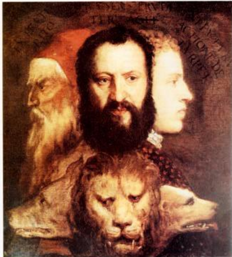
Fig. 5: Tiziano Vecelio, Allegoria del Tempo governato dalla Prudenza , 1565 circa, olio su tela 76.2 x 68.6 cm, National Gallery di Londra

di parole, da qualche parte fa notare che la forma di negazione in francese, il pas...sans , è omofona a pas de sens , ossia a nessun senso , alcun senso . Il gioco consiste nell'omofonia tra sens e sans , in cui cambia una sola lettera. Ovvero : il presente non ha alcun senso senza passare per il passato. Del resto proprio nell'ultima frase che conclude l' Interpretazione dei sogni Freud afferma che "il sogno ci porta di sicuro verso il futuro; ma questo