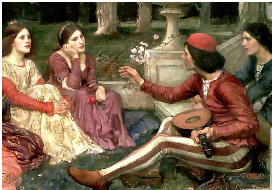
Fig. 1: John William Waterhouse, A Tale From The Decameron (1916), dipinto ad olio 102 x 159 cm, Lady lever Art Gallery Liverpool

Dunque i rifugiati aspettano a tempo debito il ritorno alla vita normale. Come la vita dei monaci che pregano e cantano “alle debite ore”, così, nel Decameron , i dieci giovani scandiscono le loro giornate con varie attività tra cui appunto, a turno, il racconto di fantasiose novelle. Alcune delle quali abbastanza licenziose, quasi a indicare, nella distanza tra le parole e i fatti, un volto inedito della sublimazione. Le cose rimangono sospese e a tempo opportuno riprenderanno.