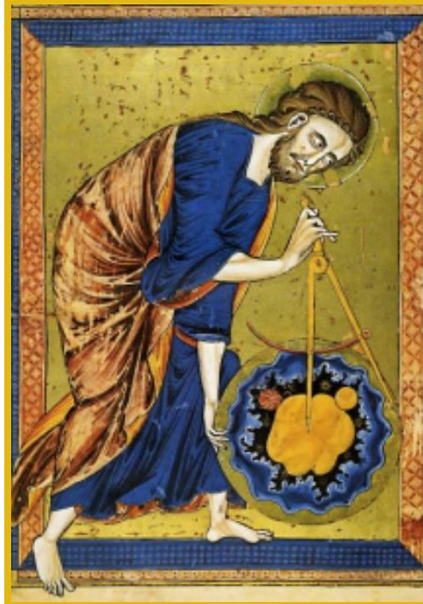
Fig. 6: Miniatura francese, 1220 ca., Bibbia nella Österreichische Nationalbibliothek di Vienna

Se il presente non accoglie il tempo della retroattività, ossia l'intendere differentemente ciò che si è sempre ritenuto di aver capito e di aver creduto, verrebbe confermata la formula di Walter Benjamin: "dominare il tempo senza aver compreso il passato". Sarà, di fatto, un dominio fallimentare, distruttivo, incoerente. "L'avvenire – nota il giurista Pierre Legendre – è una lettera timbrata. L'effetto di ritardo (" après-coup ") di quel che nominiamo presente dirà se stiamo organizzando l'autodistruzione della specie o se, più banalmente, incombe la minaccia di una schiavitù inedita, massacrando con avventatezza qualche generazione sacrificata alle facilitazioni dell'individualismo di massa."