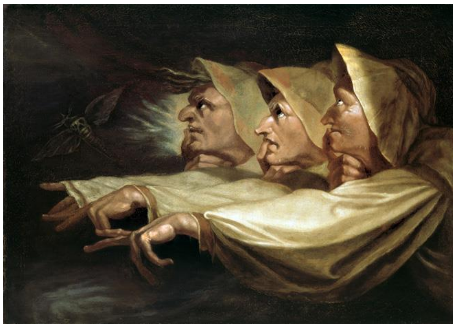
Fig. 4: Johann Heinrich Füssli, Die Drei Hexen (Macbeth I, 3), 1783 Olio su tela, cm 75 x 91,5 Kunsthaus Zürich

Freud, nel suo saggio Il poeta e la fantasia (1907) – titolo illuminante per accostarsi al tema del tempo – non si limita a considerare il presente e il futuro. Interrogandosi intorno al rapporto della fantasia con il tempo afferma: “Si deve dire che una fantasia ondeggia quasi fra tre tempi, i tre momenti temporali della nostra ideazione”. In definitiva la temporalità deve fare i conti con quello che chiamiamo passato: “Passato, presente e futuro, sono come infilati al filo del desiderio che li attraversa”. Più precisamente: “Il desiderio utilizza un’occasione offerta dal presente per progettare, secondo il modello del passato, un’immagine dell’avvenire”.